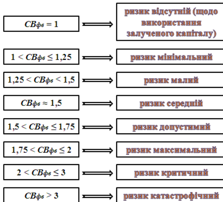
Рис. 2. Критерії ризику неповернення кредиту з відсотками банку

Виходячи з величини показника CB_{\phi\epsilon} , для оцінки ступеня ризику можна використовувати наступні критерії (рис. 2).